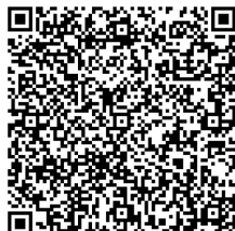
團賽報名表格下載