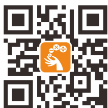
中華數學協會官網