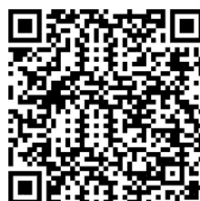
中華數學協會臉書